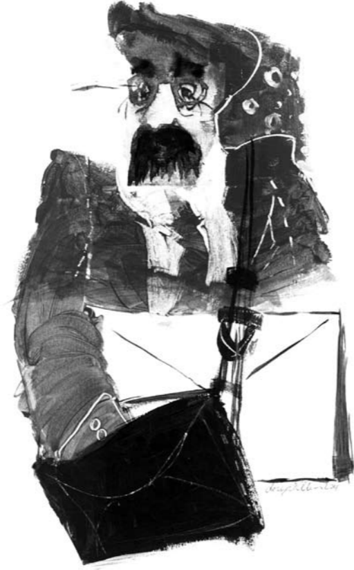
illüstrasyon: Derya Ülker