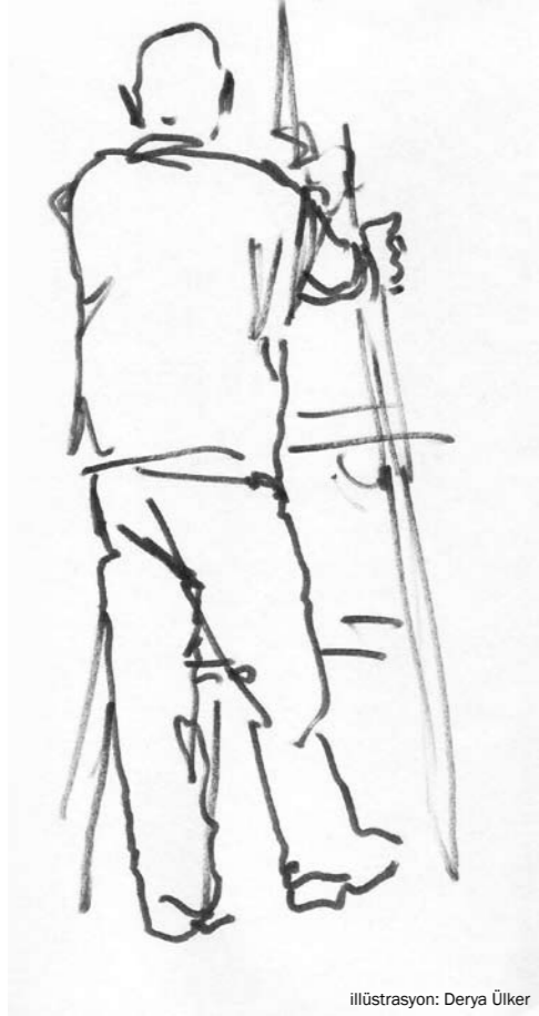
illüstrasyon: Derya Ülker

Doktora öğrencilerine verdiğim Sosyal Kuram dersinde konu ne zaman Marx'a gelse istisnasız en az bir öğrenci, yaklaşık olarak şöyle bir şey söyler: "sınıf mücadelesi Marx'ın öngördüğü biçimde tırmanmadı, tersine, günümüzde modern kapitalist toplumlarda ortadan kalktı; dolayısıyla Marx'ın yanlışlığı açık ve düşüncelerinin değerini yitirdiği ortada."